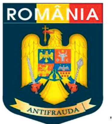
„Fig. 3.20. — Modelul emblemei aplicabile pe mâneca stângă a articolelor de echipament