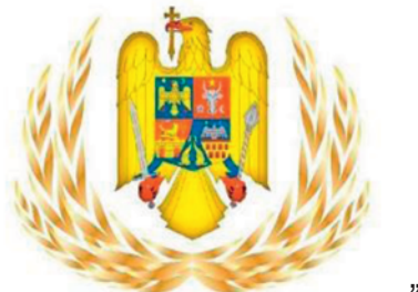
„Fig. 3.17. — Emblema coifură