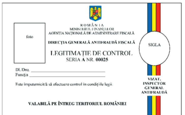
„Fig. 3.19. a — Modelul legitimației de control