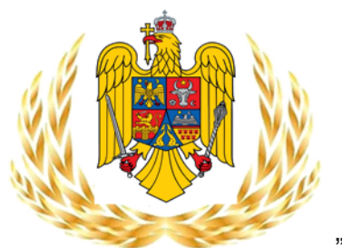
„Fig. 3.17. — Emblema coifură