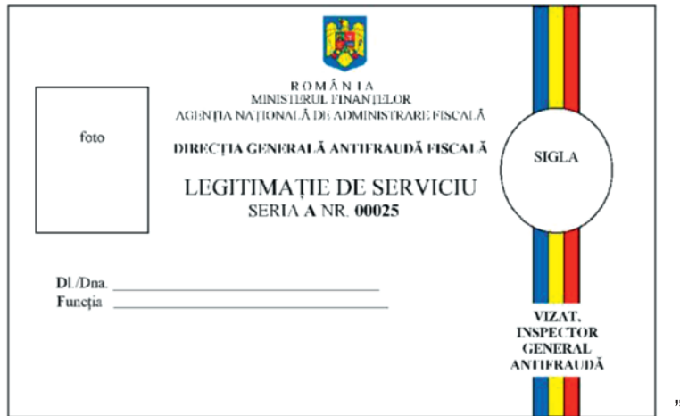
„Fig. 3.19. b — Modelul legitimației de serviciu