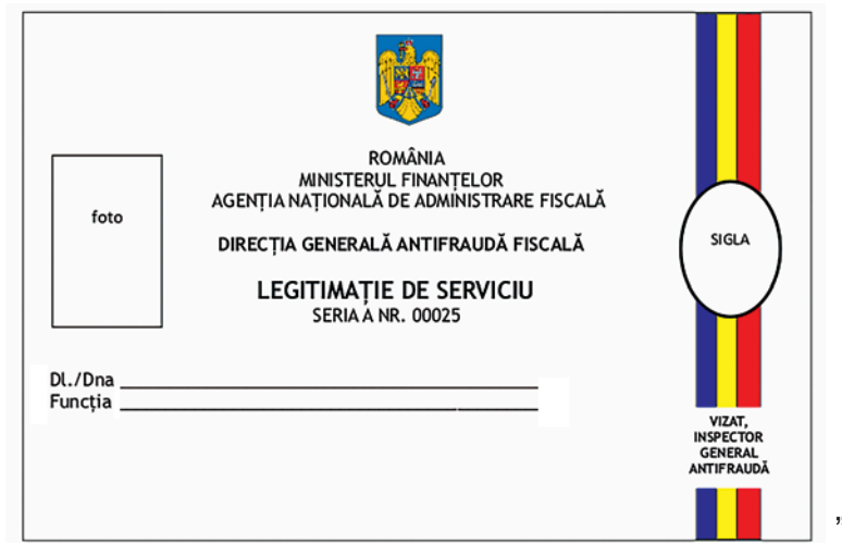
„Fig. 3.19. b — Modelul legitimației de serviciu